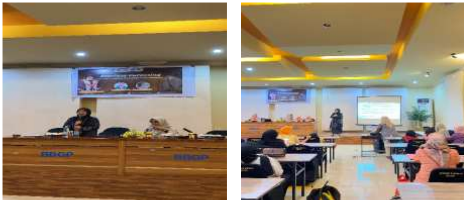
Gambar 1. Kegiatan seminar parenting