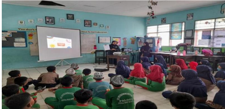
Gambar 2. Penyampaian materi edukasi gizi berbasis video di kelas, siswa tampak fokus dan memperhatikan tayangan video edukatif dengan antusias.

Sebagai bagian dari dokumentasi kegiatan edukasi, berikut disajikan beberapa foto pelaksanaan yang memperlihatkan dinamika proses pembelajaran dan partisipasi siswa: