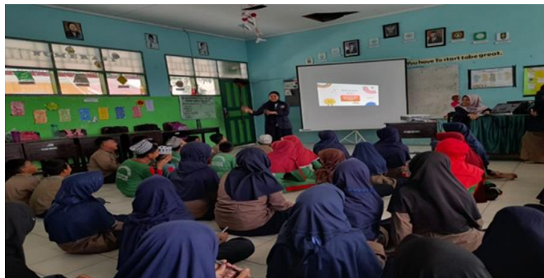
Gambar 2. Sesi diskusi interaktif setelah pemutaran video. Fasilitator memberikan pertanyaan dan siswa secara aktif merespons, mencerminkan peningkatan pemahaman mereka terhadap materi.