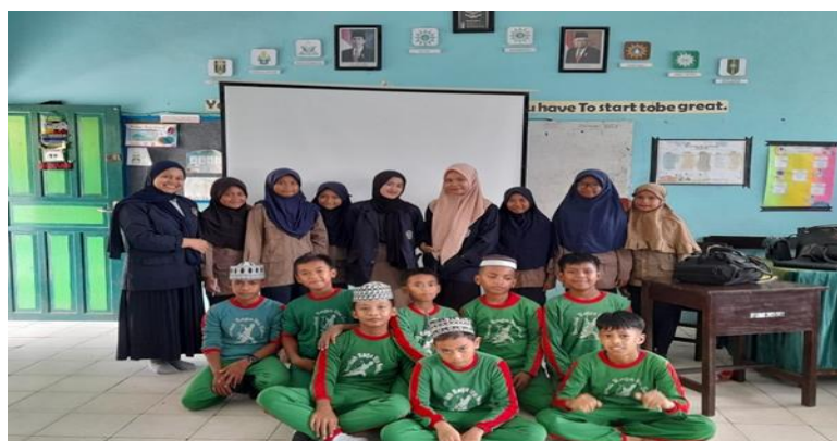
Gambar 4. Foto bersama antara tim pengabdian dan siswa peserta edukasi sebagai bentuk dokumentasi penutup kegiatan. Terlihat semangat dan keakraban antara fasilitator, siswa, dan guru pendamping.