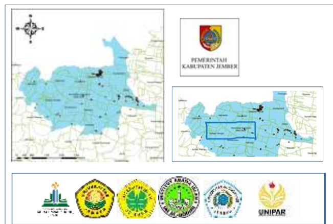
Gambar 1. Peta Lokasi Kegiatan Pengabdian di Desa Sumberwringin

Kelompok sasaran dalam pelatihan ini adalah masyarakat, Pengurus Sekolah, Kader Posyandu, dan perangkat desa Sumberwringin. Target sasaran 50 peserta. Sasaran ini ditetapkan dengan pertimbangan bahwa hasil dari budidaya