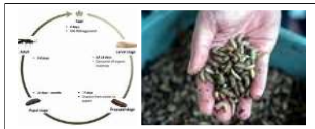
Gambar 6. Monitoring Maggot Usia 12 – 14 Hari

Pengolahan Hasil: yaitu memanen maggot setelah usia larva 12 sampai 14 hari sejak pemberian pakan sampah organik. Apabila digunakan untuk pakan ternak maka dipanen sebelum masuk fase prepupa; maggot bisa langsung dimanfaatkan untuk pakan ternak seperti unggas dan ikan, baik dalam kondisi hidup ataupun dalam kondisi kering (disimpan untuk jangka panjang dalam bentuk tepung maggot).