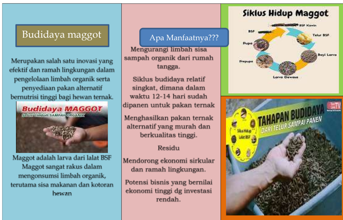
Gambar 4. Modul Pengetahuan Budidaya Maggot (halaman depan)

Hasil dari kegiatan ini adalah pengetahuan (modul) sederhana mengenai pemanfaatan dan pengelolaan sisa sampah organik melalui budidaya maggot.