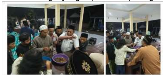
Gambar 3. Demonstrasi Budidaya Maggot

Demonstrasi yang bertujuan memperlihatkan bagaimana melaksanakan budidaya maggot. Langkah yang dilakukan adalah: mempersiapkan media budidaya, penempatan telur, siklus pertumbuhan maggot hingga panen, serta pemanenan. Berikut kegiatan sosialisasi sampai dengan demonstrasi budidaya maggot di balai desa Sumberwringin yang dapat dilihat pada gambar 3: