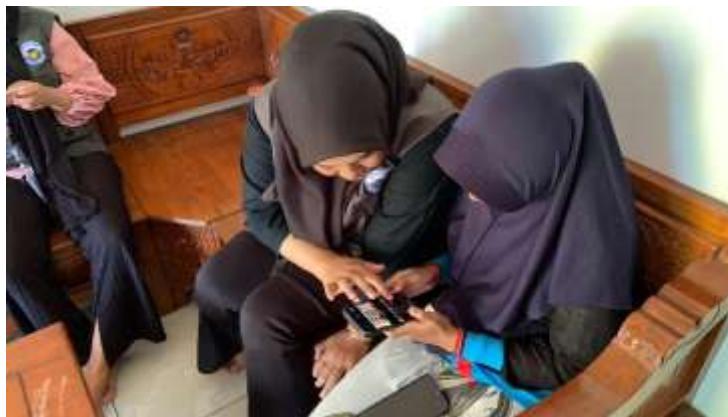
Gambar 3. Pendampingan intensif untuk mewujudkan kemandirian digital Majelis Ar-Ridwan

Memasuki agenda kedua pada tanggal 11 Agustus 2025, fokus kegiatan beralih pada penguatan kapasitas individu melalui workshop literasi digital yang intensif. Tantangan utama yang dihadapi adalah rendahnya tingkat pemahaman teknologi dasar di kalangan anggota, di mana banyak di antaranya belum terbiasa mengoperasikan fitur internet secara produktif. Tim pengabdian melakukan pendekatan personal yang hangat untuk mengatasi hambatan psikologis berupa kekhawatiran peserta terhadap teknologi. Workshop ini dirancang dengan metode learning by doing , di mana setiap penjelasan teori langsung dipraktikkan menggunakan gawai milik masing-masing anggota sebagai bentuk optimalisasi aset fisik.