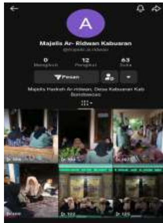
Gambar 6. TikTok Ar-Ridwan sebagai bukti nyata bahwa tradisi lokal mampu bersinar di panggung global

memanfaatkan algoritma TikTok secara efektif sehingga mampu menembus total 63 tanda suka ( likes ). Dua video unggulan bahkan berhasil memperoleh masing-masing 123 dan 120 penayangan dalam waktu singkat, sebuah angka yang melampaui jumlah pengikut akun yang baru berjumlah 12 orang. Hal ini menunjukkan bahwa platform TikTok memiliki kekuatan distribusi konten yang luar biasa, di mana konten tradisional religius pun dapat diterima secara luas jika dikemas dalam format video pendek yang dinamis.