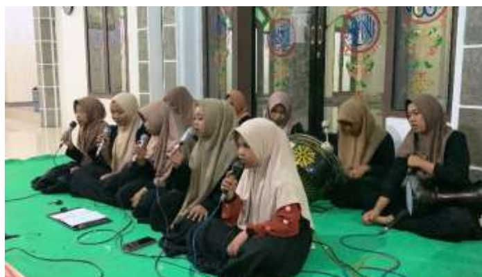
Gambar 2. Upaya mengabadikan ketukan rebana melalui teknologi agar tak lekang oleh waktu

Agenda pertama dilaksanakan pada tanggal 25 Juli 2025 dengan fokus utama pada produksi konten audiovisual berkualitas tinggi yang representatif. Sebelum proses pengambilan gambar dimulai di serambi Masjid Al-Ikrom, tim pengabdian bersama anggota majelis melakukan koordinasi teknis terkait tata panggung sederhana, pengaturan pencahayaan alami, serta pemilihan lagu sholawat. Pengaturan ini sangat penting untuk menghasilkan visual yang estetik namun tetap menjaga kekhidmatan ritual keagamaan. Para anggota majelis terlihat antusias menyiapkan peralatan rebana dan mengenakan seragam terbaik, menunjukkan kesiapan mereka untuk tampil di hadapan audiens digital secara luas.