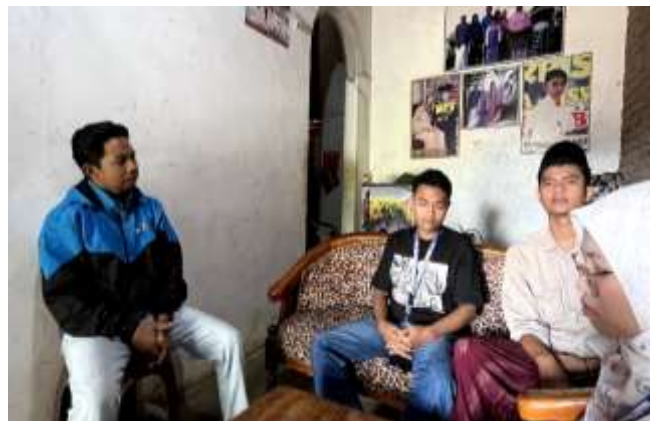
Gambar 1. Proses dialog partisipatif bersama pimpinan Majelis Hadrah Ar-Ridwan untuk menyelaraskan nilai spiritual hadrah dengan media sosial.

Kegiatan dimulai pada tanggal 13 Juli 2025 melalui observasi lapangan yang bertujuan untuk memahami konteks sosial dan lingkungan tempat Majelis Ar-Ridwan bertumbuh. Tim pelaksana melakukan pengamatan terhadap aktivitas rutin desa, tata letak fisik Masjid Al-Ikrom, serta bagaimana interaksi sosial terjadi selama tradisi sholawat berlangsung. Observasi ini menjadi sangat krusial untuk memetakan titik nol literasi digital masyarakat secara umum, sekaligus melihat potensi visual yang dapat diangkat ke media sosial. Dari pengamatan awal ini, tim menemukan bahwa Majelis Ar-Ridwan bukan hanya kelompok seni, melainkan institusi sosial yang memiliki pengaruh kuat di Desa Kabuaran.